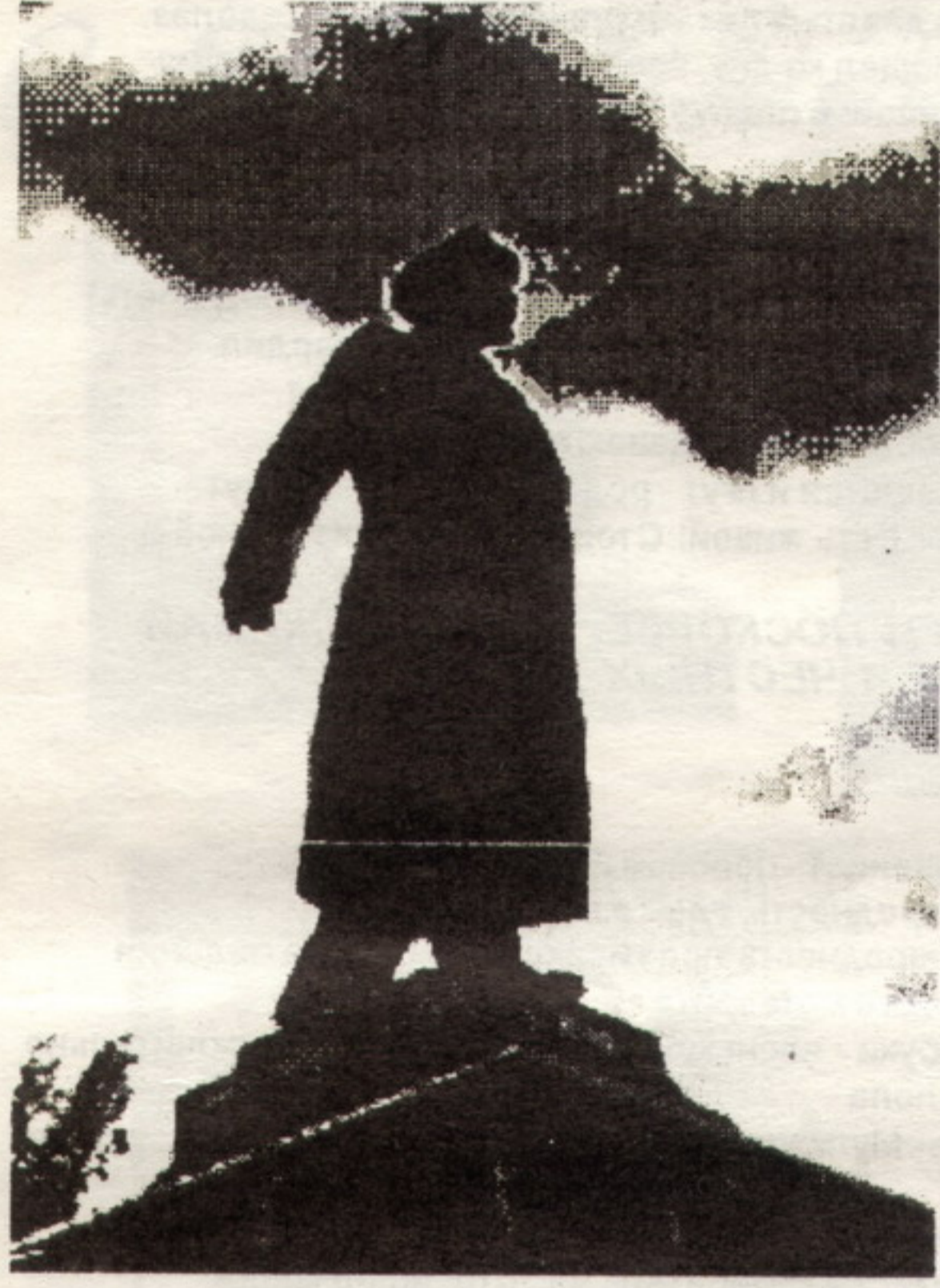
Что-то с логикой у нас стало...

взять? Или мышцу накачать, аки камеру велосипедную, лицо отъесть, да "Адидас" справить и за работу, а ее - поле непаханное. Ну, а если я не хочу свои конечности развивать, или хочу, а негде. Был у нас когда-то в Черняховске приличный атлетический клуб. Закрыли, естественно, ибо кости трещат, резинки рвутся, снаряды поскрипывают-жильцам мешают отбивающимся. Так куда ж податься? Работать бы пошел - пусть меня научат. Бесплезняк. Если раньше "ЧМЗ", "Техмаш" или ДОК, иже с ними, тебя, тинейджер ты мой неформальный, с удовольствием бы приняли в качестве дешевой рабочей силы. Станок бы тебе дореволюционный подогнали, да денег рублей 150 положили. А сейчас-то что? Вмяк полная лажа. Заводы-фабрики еле