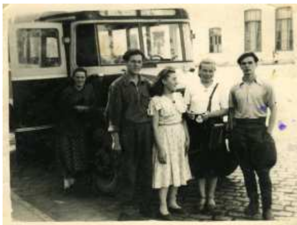
Возле автостанции, 50-е годы.