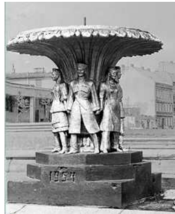
Фонтан «Дружба народов» на Театральной площади