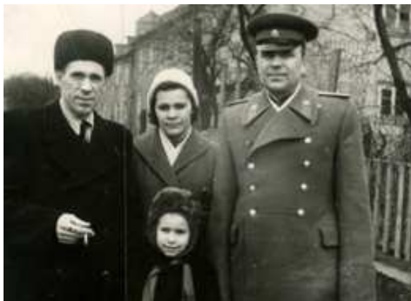
Отец (слева) с семьёй на улице Элеваторной. 1959 г.

гали взрослым: пасли скот, пахали землю на волах, возили сено. В холодное время года в школу ходили по очереди, потому что на всех была одна пара ботинок. Вместо тетрадей писали на газетах карандашом. Бумага считалась роскошью. Мама, если пол в хате был земляным, а не дощатым, как в зажиточных семьях, и крыша крыта соломой? За хворостом для печи надо было идти в лес, через поле. Мама рассказывала, как однажды зимой она одна тянула сани с хворостом по занесённому снегу полю и увидела волка. Он стоял и смотрел на девочку, которая в страхе замерла на месте. Волк постоял, посмотрел и... побежал прочь. «Наверное, негодный был», — объясняла мама. На самом высоком месте в селе стояла белая церквушка, внутри её стены были покрыты фресками. Колхозное руководство устроило в этой церкви склад зерна, о чём мама до последних лет вспоминала с горечью: «Такое было время». Дети рано начали работать в колхозе, помо-