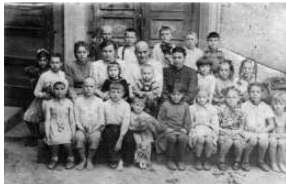
1947-1948 учебный год