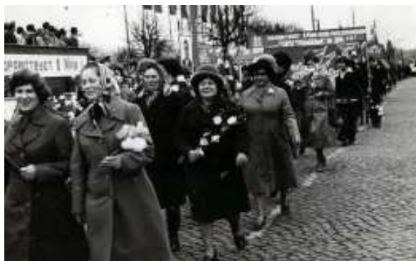
На демонстрации 1 мая 1980 г.

Янтарный край, Цвети под небом синим! Пусть небеса хранят наш общий дом! Янтарный край — жемчужина России — Природой славен и людским трудом.