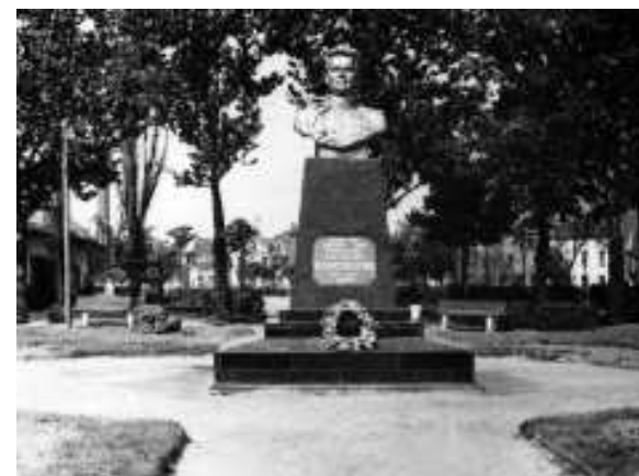
Памятник И.Д. Черняховскому в сквере около кинотеатра «Октябрь»