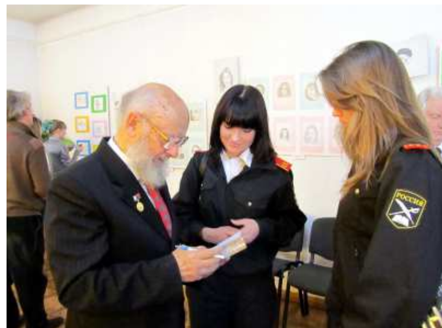
5-й молодёжный поэтический конкурс «Филір», 26 марта 2011 г.