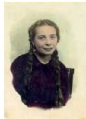
Студентка МХУ, Москва, 1944 год