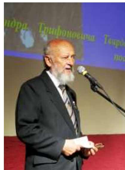
1-е Тёркинские чтения, 19 июня 2010 г.

А я другую роль беру — Ей в лоб перчатку кинуть. Я дуэлянт. Свою беду Зову на поединок.