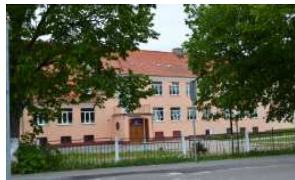
Школа в наши дни

Хочется отметить, что выпускники 60-х, 70-х годов реагируют на выпуск книги восторженно, она им нужна, поэтому продолжаю отправлять посылки в разные города.