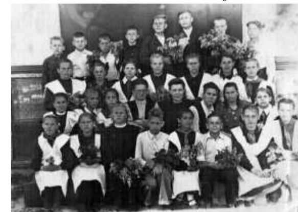
1952 год, 7-й класс