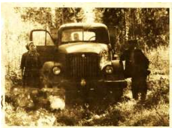
Приехали в лес готовить дрова, 1959 год

Мои родители прожили вместе до последних дней своей жизни. Всегда с интересом вспоминали свои прожитые годы, говорили и о трудностях, которых тоже хватало, но никогда не жалели, что приехали именно в Калининградскую область.