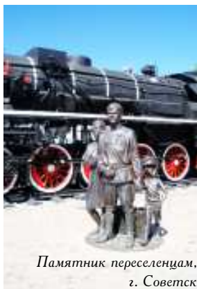
Памятник переселенцам. г. Советск

Конечно, многого не хватало — продуктов, одежды. Но все терпели. Главное, нет войны! А всё остальное — дело наживное! Отменили продовольственные карточки, снизили цены — радость! Нет транспорта — да Бог с ним! Мы и пешком дойдём! Потихоньку при-