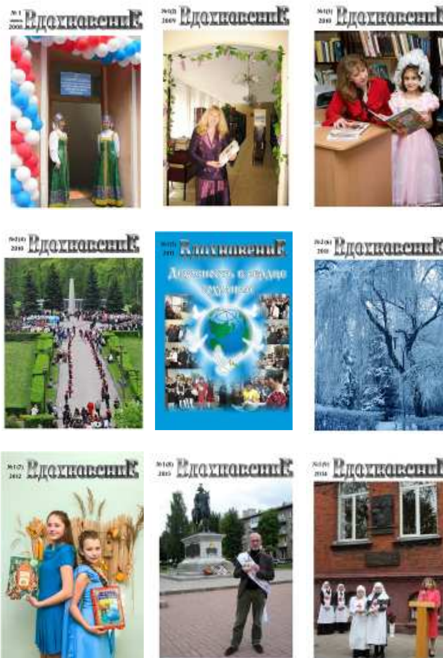
Фото на обложке: стр. 1 — Валентины Поздняковой стр. 4 — коллаж Светланы Кожевниковой

Фото из архива библиотеки, Наталии Кочерговой, Светланы Новиковой, Лидии Ганиной, Людмилы Недзельницкой и других авторов