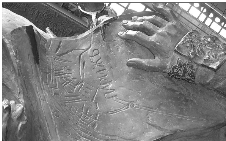
В руке полководца – план обороны Парижа (деталь памятника М.Б. Барклаю-де-Толли).