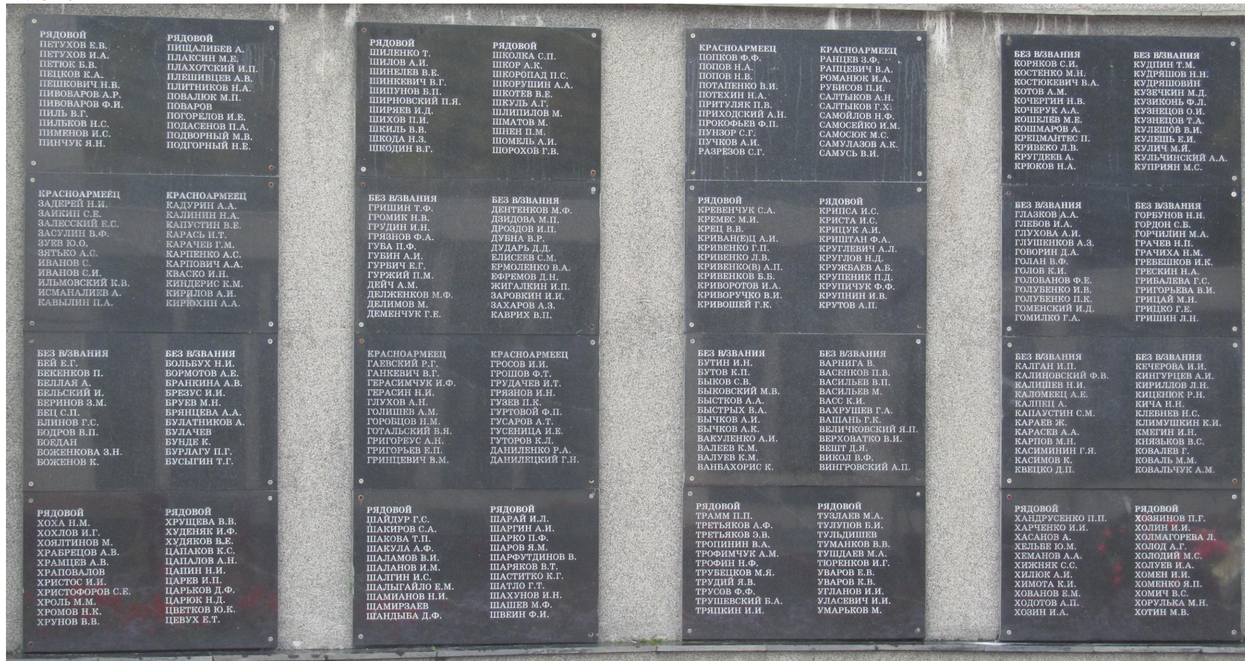
Фото Галины Каштановой-Ерофеевой. Снимок общего вида Мемориала (в левом нижнем углу 1-й стр.) – Виктора Васильева.