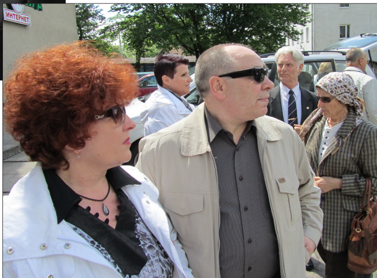
В Гвардейск, на Литературные чтения, получившие название Теркинских, прибыли гости из разных городов области – Калининграда, Балтийска, Черняховска, Советска.