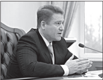
Губернатор твердо заявил, что не даст возможности повысить тарифы

Черняховский авторемзавод поставил вопрос погашения не только долгов, но и пени. С РЖД, СП «Энергетика и Экология» графики погашения долгов пока не согласованы и не подписаны. С ООО «Форс-Ойл» график согласован, но также не подписан. Балтийская угольная компания отказалась подписывать график, погашение долгов будет с помощью правительственных гарантий. Уже погашены 309 тысяч рублей правительственных гарантий. Необходимо возвращать муниципальный кредит, уже погашены 3,5 миллиона рублей.