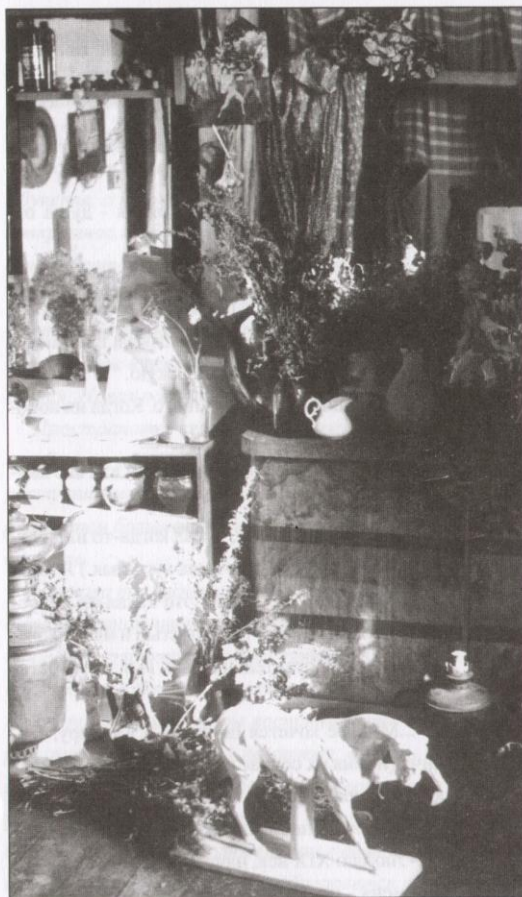
Мастерская художника