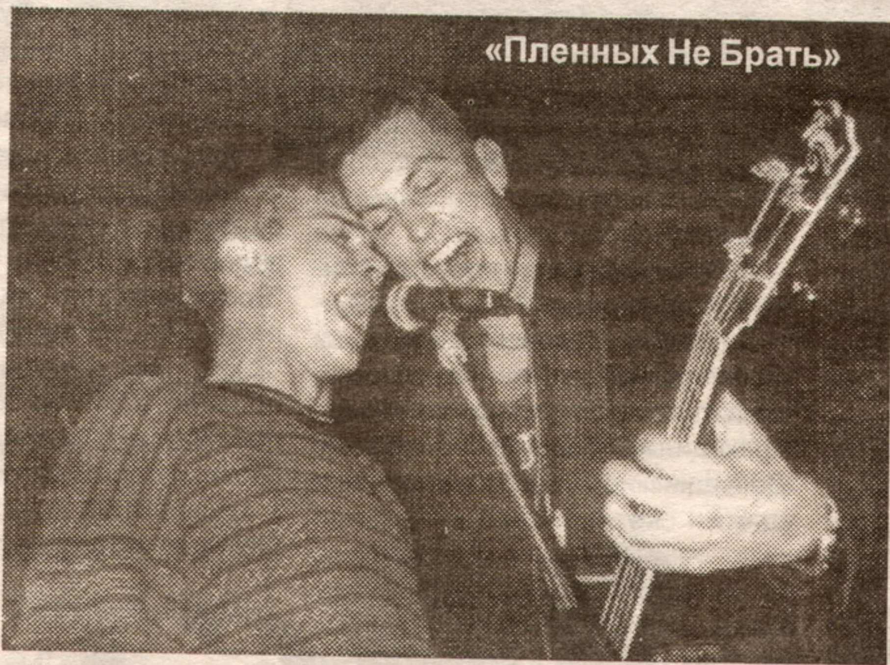
«Пленных Не Брать»