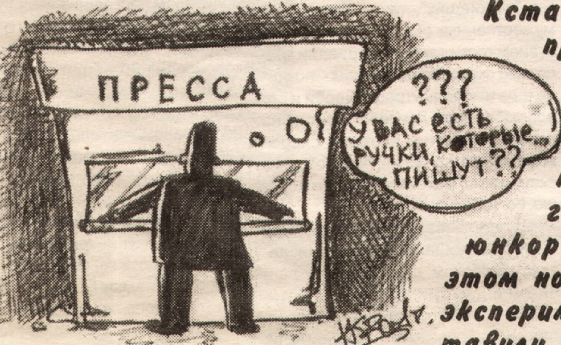
Рис. Н. Ивановича

Кстати, желающих попробовать себя в написании письма просим в наш журналистский круг. На следующий год у нас большие юнкорские планы. В этом номере мы решили не экспериментировать и оставили все старые рубрики на месте, начав их хроникой дней минувших. Вот, пожалуй, и все. Пишите письма разным почерком. Вус!