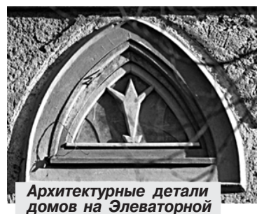
Архитектурные детали домов на Элеваторной