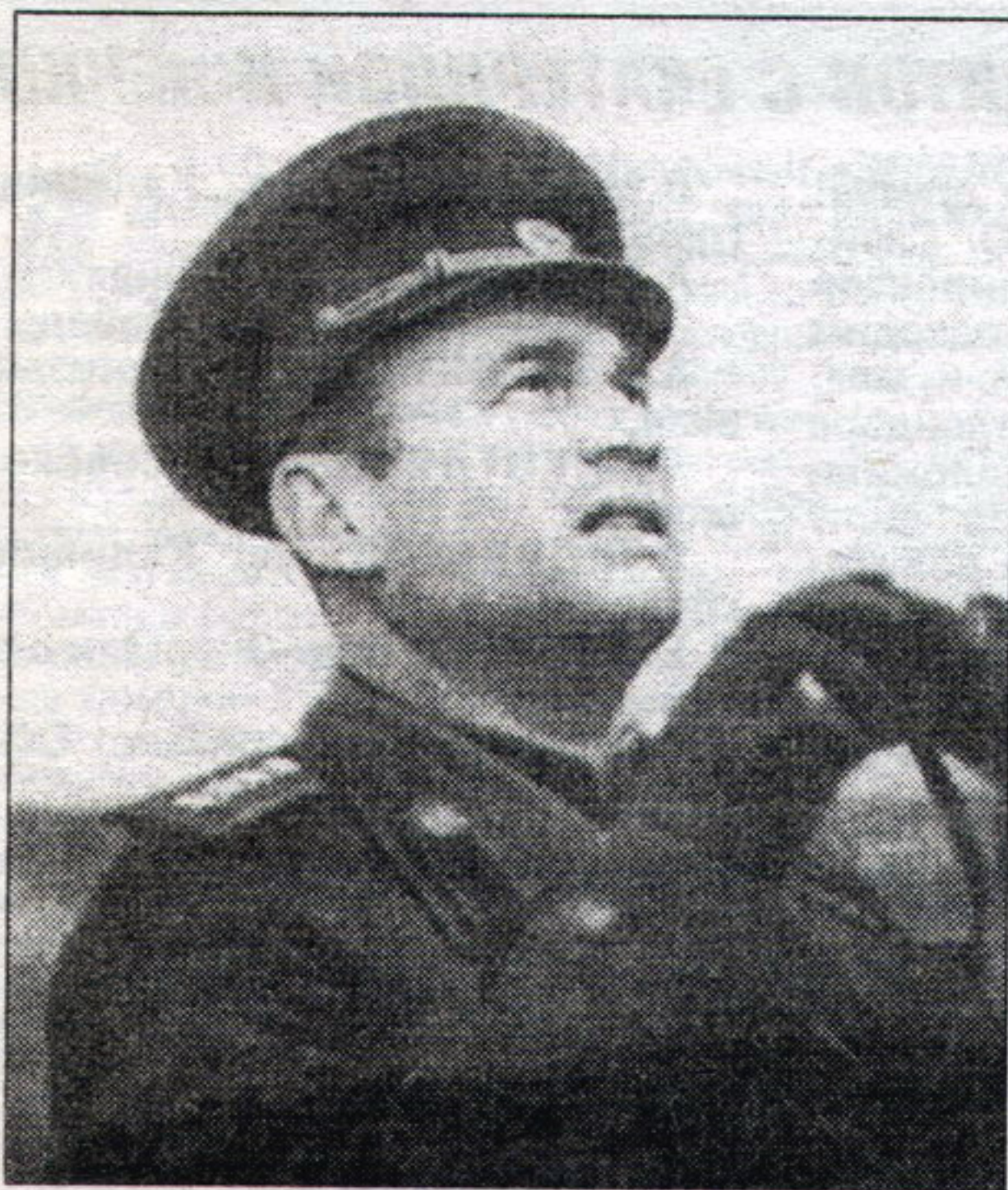
И.Д. Черняховский наблюдает боевые действия летчиков генерал-полковника авиации Т.Т.Хрюкина. 1945 г.

18 февраля - особая дата в нашем календаре. В 1945 году, 60 лет назад, этот день стал днем скорби: ушел из жизни талантливый военачальник, самый молодой командующий фронтом времен Великой Отечественной войны - генерал армии Иван Данилович Черняховский. Но сила и обаяние яркой и одаренной его личности столь велики, что память о нем живет, несмотря на перемены «политического климата» и экономической обстановки.