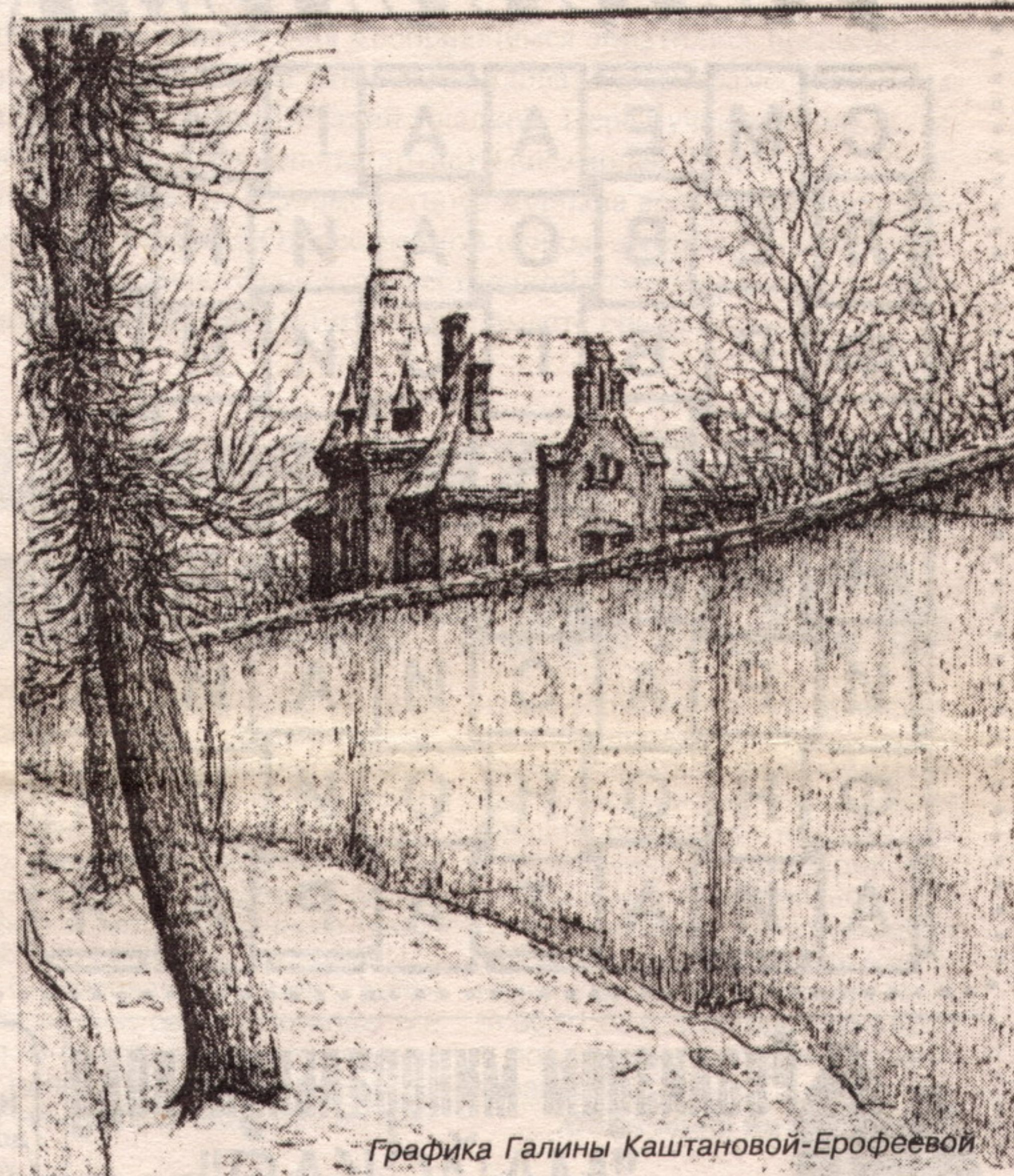
Графика Галины Каштановой-Ерофеевой

Вымощены улицы С точностью хирурга, Вылущены окна В белый свет большой.