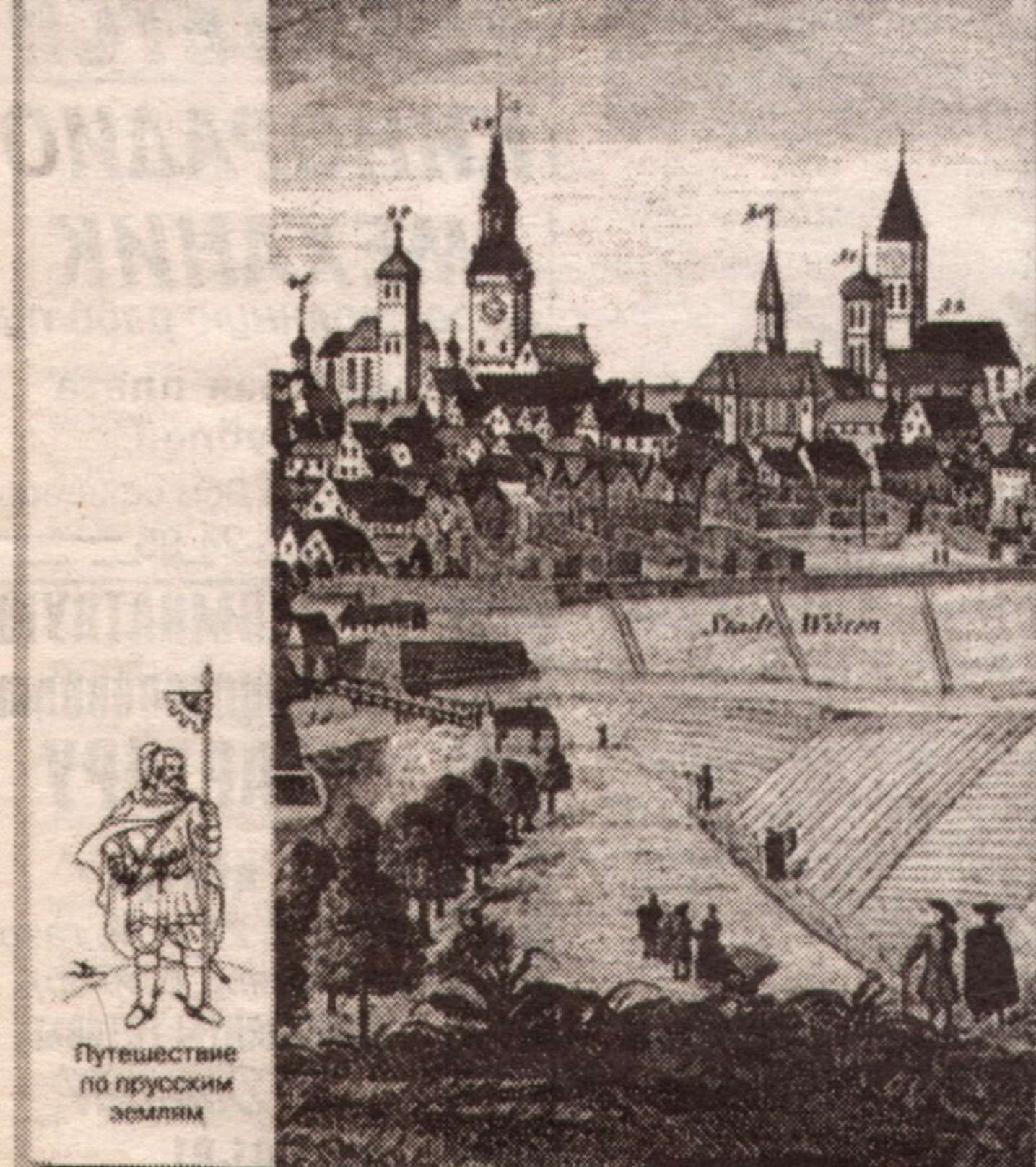
Путешествие по прусским землям

об орденских замках и соборах, о полях сражений и природно-исторических ландшафтах - своеобразных вехах на "неисповедимых" путях Времени. Автор не только знакомит нас с "Азбукой истории" родных нам мест, но и сообщает о том, какими именами называли их древние обитатели, кто из "именитых гостей" и когда здесь бывал, рассказывает об исторических маршрутах по землям пруссов - Самбии, Натангии, Надравии, Скаловии, Бартии. Знание истории нашей земли, таинственной и нередко "причудливой", многообразных культурных традиций разных народов, обретающих здесь приют, включает в себе немалый конструктивный потенциал. Автор утверждает: если мы будем иметь представление не только об "общих контурах" прусской истории, но и о далеком и недавнем прошлом города или села, в которых ныне живем, наши сердца наполнятся гордостью за Янтарный край с его уникальной судьбой.